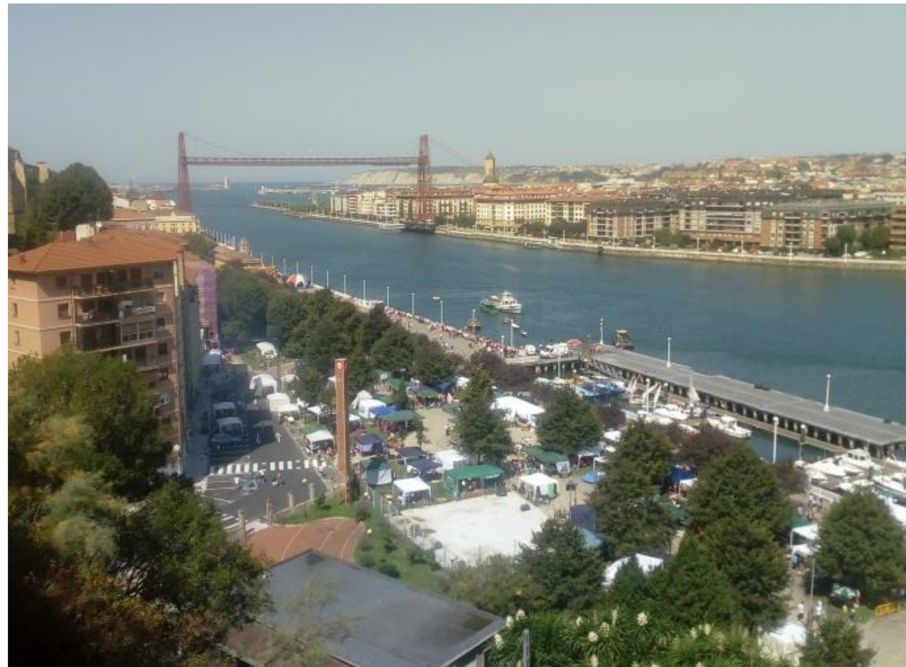
Portugalete busca un día de 2022 para marcar en rojo en el calendario, como el de San Nikolas. M. A. P.

MIGUEL A. PARDO / PORTUGALETE | 31.10.2020