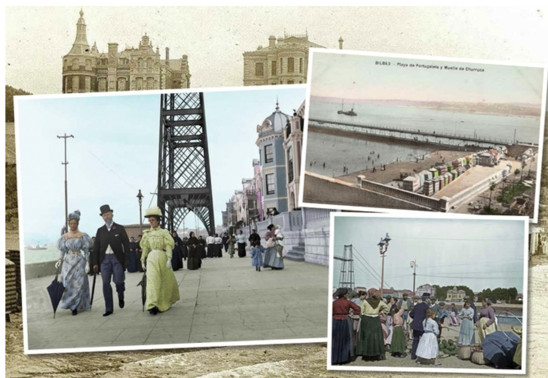
Se repartirán 23.000 ejemplares del calendario.

Sin duda alguna, el año 2022 va a quedar grabado en letras de oro en la historia de la villa de Portugaleta. No en vano, el próximo año se celebrará el 700 aniversario de la fundación de la villa y, como no podía ser de otra manera, ese redondo cumpleaños será el gran protagonista del almanaque municipal de Portugaleta. Este calendario se repartirá puerta a puerta por los 23.000 hogares portugalujos y, además, el almanaque incluye un bono de descuento del 50% en las instalaciones de agua de Pando Aisia. Se estima que el reparto comenzará hoy mismo, por lo que las familias portugalujas podrán dar la bienvenida al nuevo año colgando en su rincón más preciado este calendario que será pura historia.