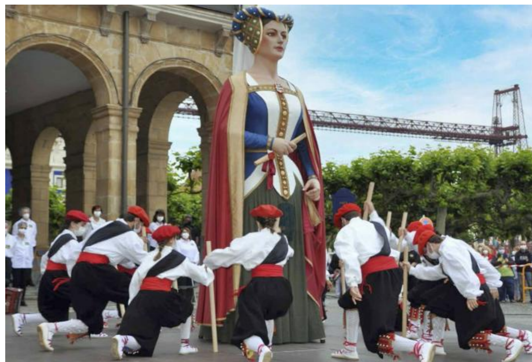
Imagen de la presentación en junio de la gigante Doña María.

MIGUELA A. PARDO / PORTUGALETE | 10.12.2021 | 00:28