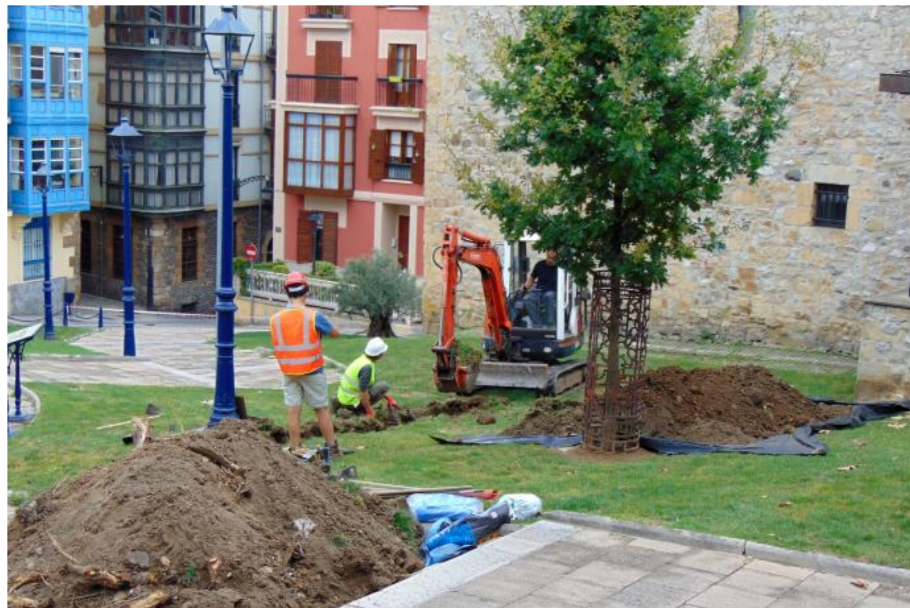
Los sondeos arqueológicos comenzaron ayer lunes. M. A. Pardo

MIGUEL A. PARDO / PORTUGALETE | 14.09.2021 | 01:00