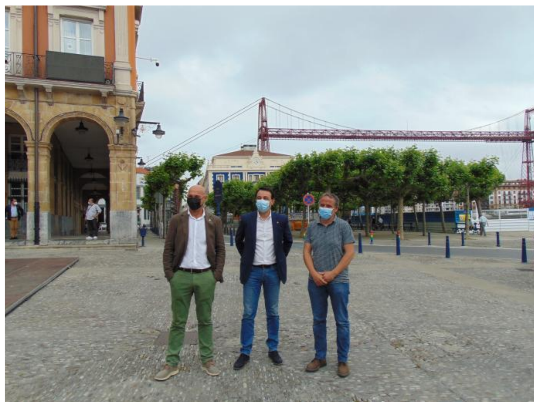
Portugaleta, Ondarroa y Lekeitio, villas fundadas por María Díaz de Haro, se reunieron ayer.

MIGUEL A. PARDO/ PORTUGALETE | 12.06.2021 | 01:14